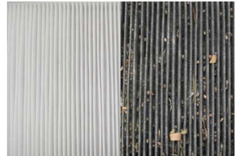
nieuw interieurfilter na 30.000 km

Bij de aircoservice wordt ook het interieurfilter, dat alle inkomende lucht van buitenaf filtert, gecontroleerd. Op dit filter blijft veel vuil zitten en daarom moet dit regelmatig vervangen worden.